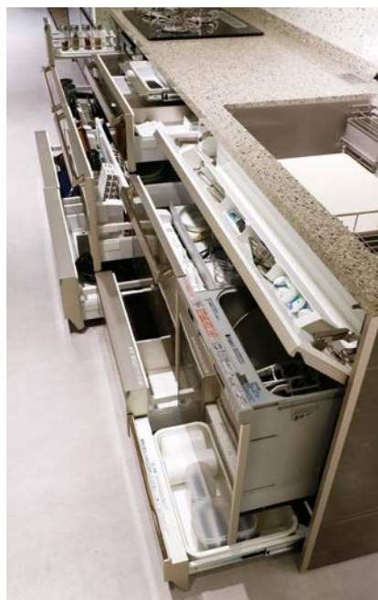
たっぷり入って、出し入れしやすいキャビネット収納

「マグネットが付くというホーローの利点を活かす」 「マグネットが付くというホーローの利点を活かす」 「マグネットが付くというホーローの利点を活かす」