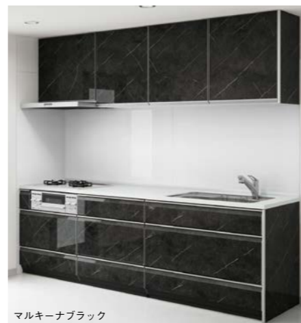
マルキーナブラック