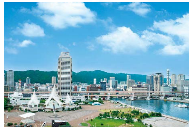
ホテルオークラ神戸 外観