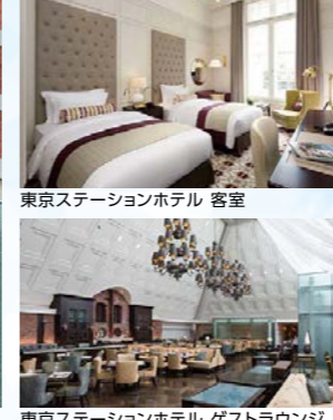
東京ステーションホテル ゲストラウンジ