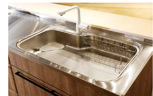
人気の「流レールシンク」には15cmワイドになった大容量タイプがオプションで新登場