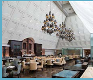
東京ステーションホテル ゲストラウンジ