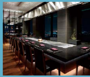
ホテルオークラ神戸 レストラン