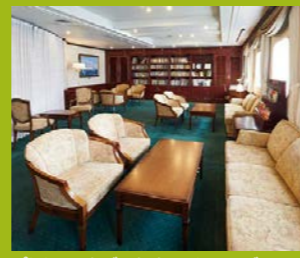
ぱしふいっくびいなす ライティングルーム