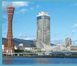
ホテルオークラ神戸 外観