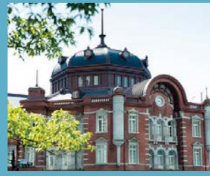
東京ステーションホテル 外観