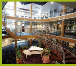
ぱしふいっくびいなす エントランス