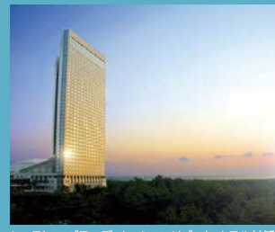
シェラトン・グランデ・オーシャンリゾート ホテル外観