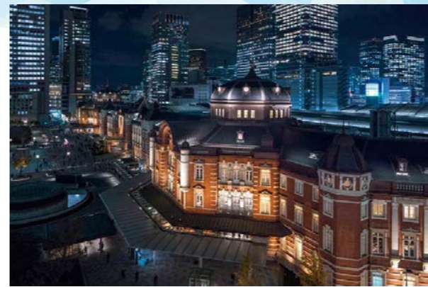
東京ステーションホテル 外観