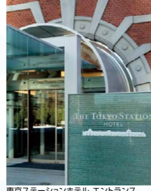
東京ステーションホテル エントランス