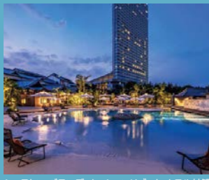
シェラトン・グランデ・オーシャンリゾート ホテル外観