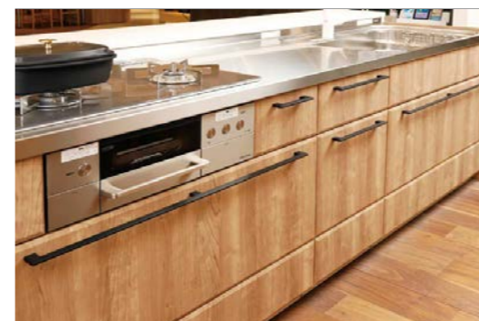
キッチン側の天板（ワークトップ）は、お手入れしやすく使い勝手にすぐれたステンレス。特殊コーティングで油汚れを浮き上げらせるクリナップ独自の「美コートワークトップ」もお選びいただけます

「デュアルトップ対面を採用したSTEDIAでは、従来のフラット型の対面キッチンのような1枚の大きな天板を必要としないため、コストダウンを実現しています。例えば、リビング側はリビングのインテリアと合わせて明るく清潔感のある大理石調に。キッチン側のワークトップは衛生的で毎日のお手入れもしやすいステンレスに、と自由な組み合わせをお選びいただけます。ご要望に合わせて天板だけでなく扉やサイドパネルなどの組み合わせを選べるのでデザインの自由度が非常に高くなりました。しかも、全体のご予算はリーズナブルに。憧れの対面キッチンを、ぐっと身近に感じていただけるはずです。お客様の声から生まれた、新発想の対面キッチンSTEDIAを、ぜひショールームで体験してみてください。皆様のご来場を心よりお待ちしております」