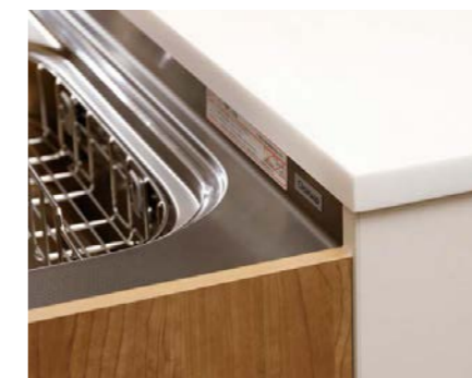
天板の段差は“絶妙な”65mmに